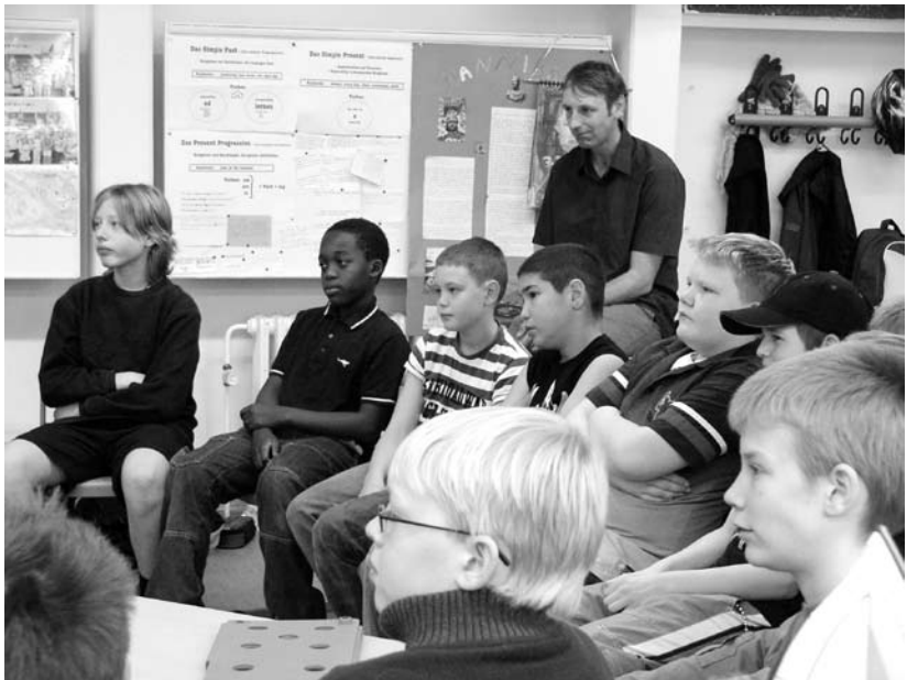
Projekt „WasferJungs!“ Julius-Leber-Gesamtschule 2007

Das Durchschnittsalter der hauptberuflichen Lehrerinnen und Lehrer an allgemeinbildenden Schulen ist weiter gestiegen. Nach einer Studie des Deutschen Instituts für Wirtschaftsforschung (DIW) aus dem Jahre 2007 werden im Jahre 2020 nur noch 29 % der derzeit beschäftigten Lehrer unterrichten. Auch wenn damit gerechnet wird, dass die Schülerzahl an allgemeinbildenden Schulen mittelfristig sinkt, wird ein hoher Bedarf an Lehrkräften bleiben.