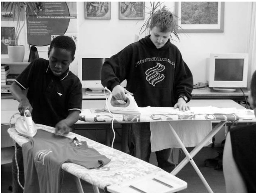
Projekt „WasfuerJungs!“ Julius-Leber-Gesamtschule 2007