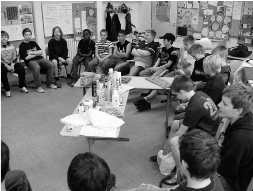
Projekt „Was fuer Jungs!“ Julius-Leber-Gesamtschule 2007

Mütter und Väter können einen Elternabend in der Schule dafür nutzen, die Erwartungen ihrer Kinder an sie in Bezug auf die Berufswahl besser kennenzulernen. In Vorbereitung auf solch einen Elternabend können Lehrkräfte die Mädchen und Jungen bitten, ihre Ansprüche, Erwartungen, Wünsche, Hoffnungen an die Eltern aufzuschreiben. Erfahrungsgemäß wollen z.B. 15-jährige Mädchen und Jungen „...nicht gelenkt und beeinflusst, aber möglichst kompetent beraten, emotional gestützt und aufgefangen werden.“ Allerdings: „In fast jeder Klasse gibt es ein bis zwei Jugendliche, die keine Erwartungen mehr an ihre Eltern haben. „Ich erwarte nichts. Meine Mutter meint, dass ich selber wissen muss, was ich werden will.“ (Höke 2000). Die folgenden Originalzitate machen deutlich, dass die meisten Jugendlichen doch noch im Kontakt mit ihren Eltern stehen und ganz konkrete Erwartungen äußern: